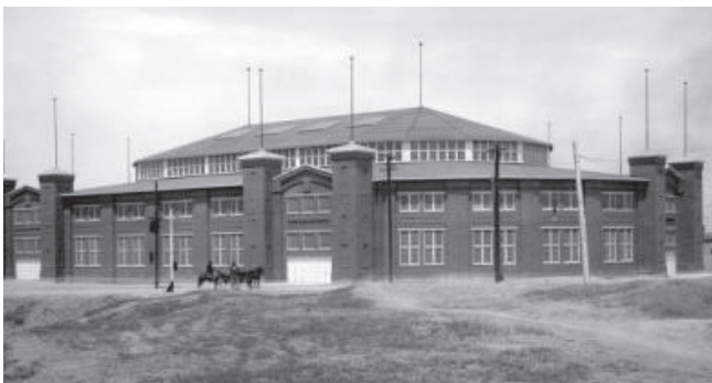
El edificio de ladrillo y acero del Estadio de 1909 en el 4655 de la calle Humboldt fue el lugar de entretenimiento principal de la Feria Agropecuaria National Western desde 1908 hasta 1951, y será utilizado por la Feria Agropecuaria hasta 2025.

Este proyecto preparará el escenario para un vibrante centro de comida local, fresca, saludable y asequible. En respuesta a los deseos de la comunidad, un mercado de este tipo satisfará las necesidades de compras diarias en Globeville y Elyria-Swansea (GES) por primera vez en generaciones.