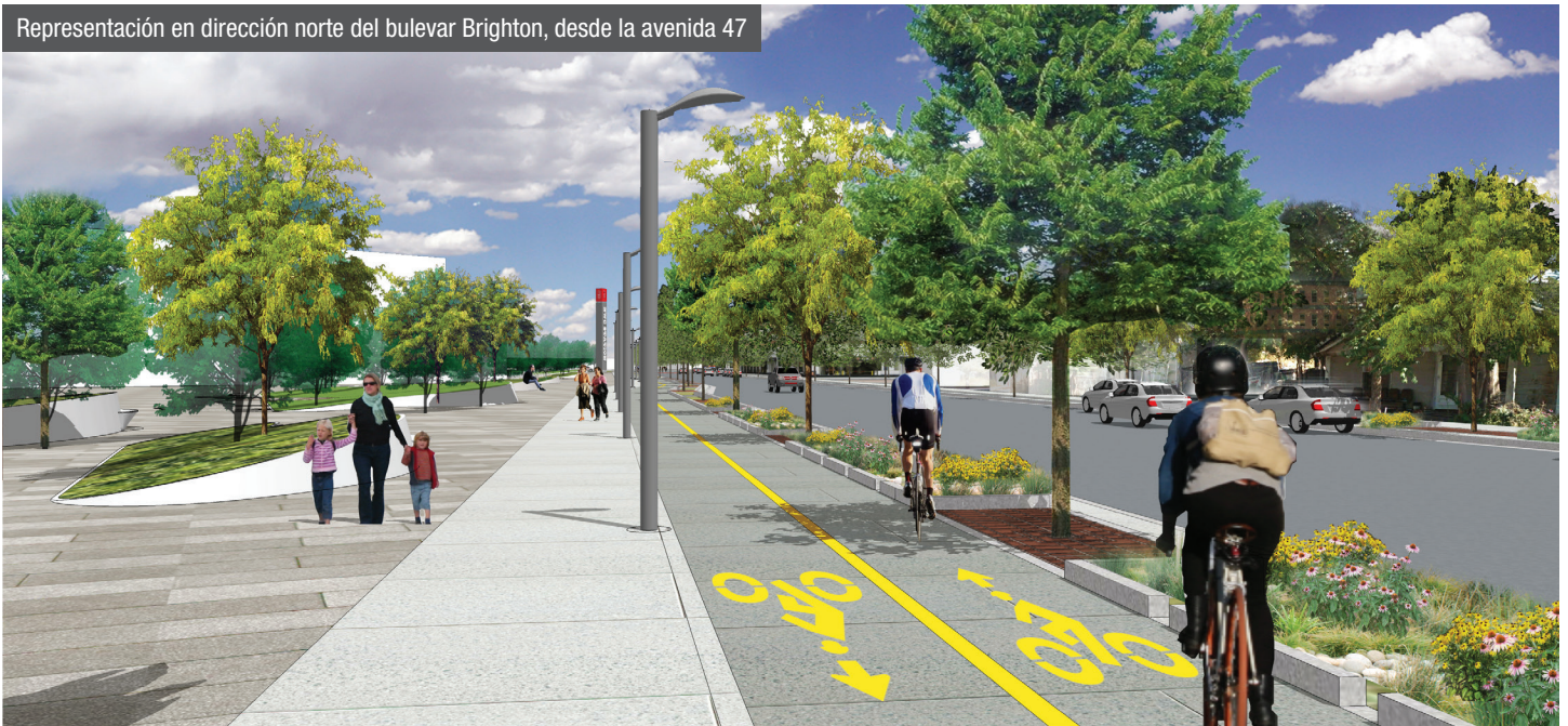
Representación en dirección norte del bulevar Brighton, desde la avenida 47

Este proyecto impulsará lo previamente logrado y suministrará 100 por ciento del diseño del bulevar Brighton desde la avenida 47 hasta la calle Race Ct.